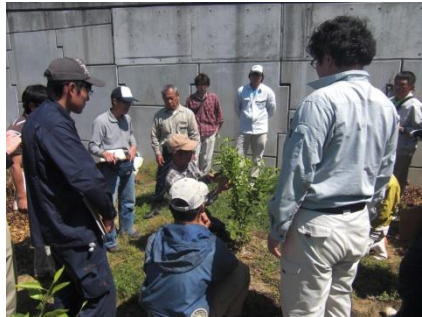
アグリビギナー研修