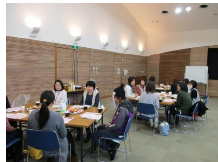
プレイベントの意見交換会

プレイベントで得られた意見をもとに、第1回の研修会は6~7月頃に開催予定です。内容が決まりしだい、市町を通じてお知らせしますので、よろしくお願いします。