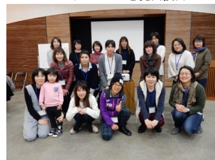
プレイベント参加者で記念撮影